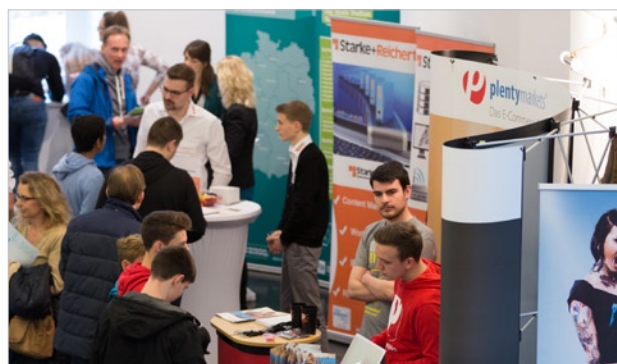
Begleitende Infostände der IT-Unternehmen