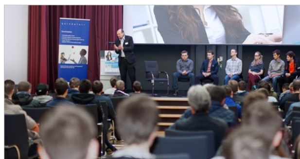
Podiumsdiskussion mit Azubis und Schülern