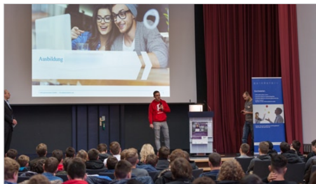
Anspruchsvolle Vorträge von Auszubildenden